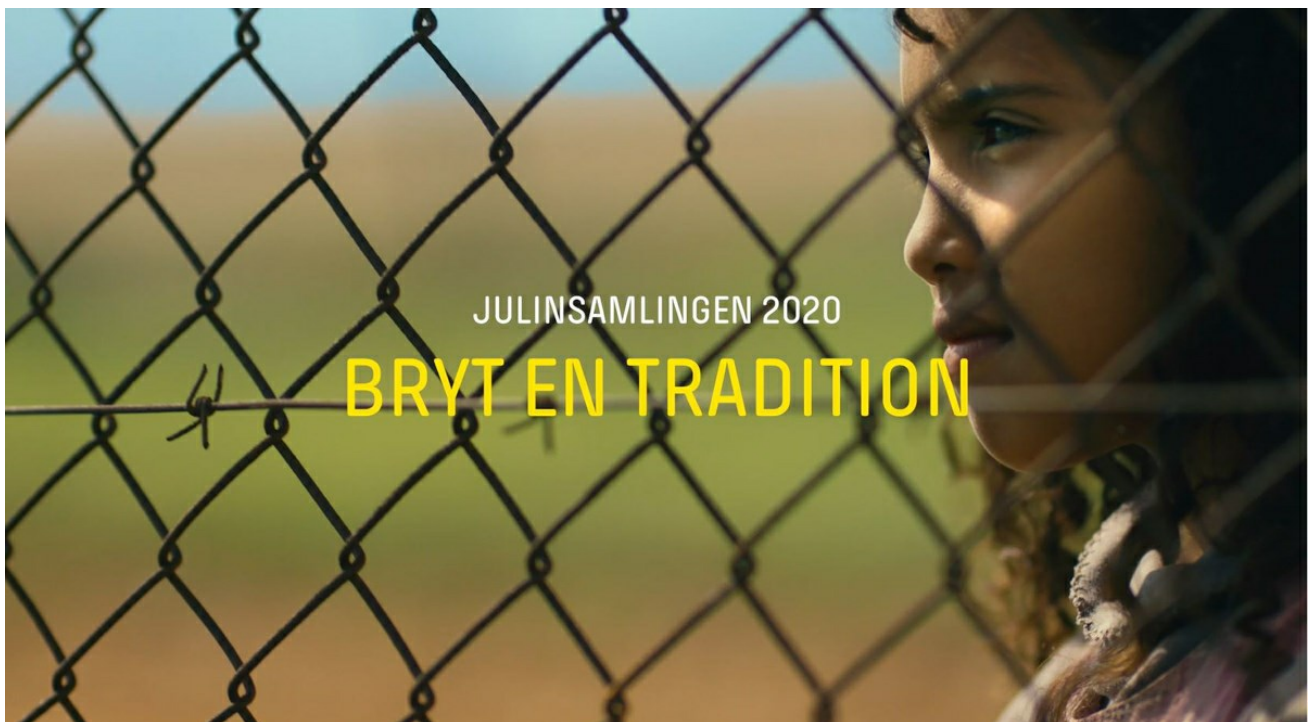
Stillbild ur upptaktsfilmen